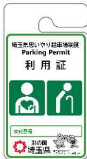
その他障害者、 要介護者等用